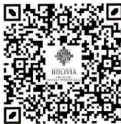
Guía Operativa PROVEEDORES